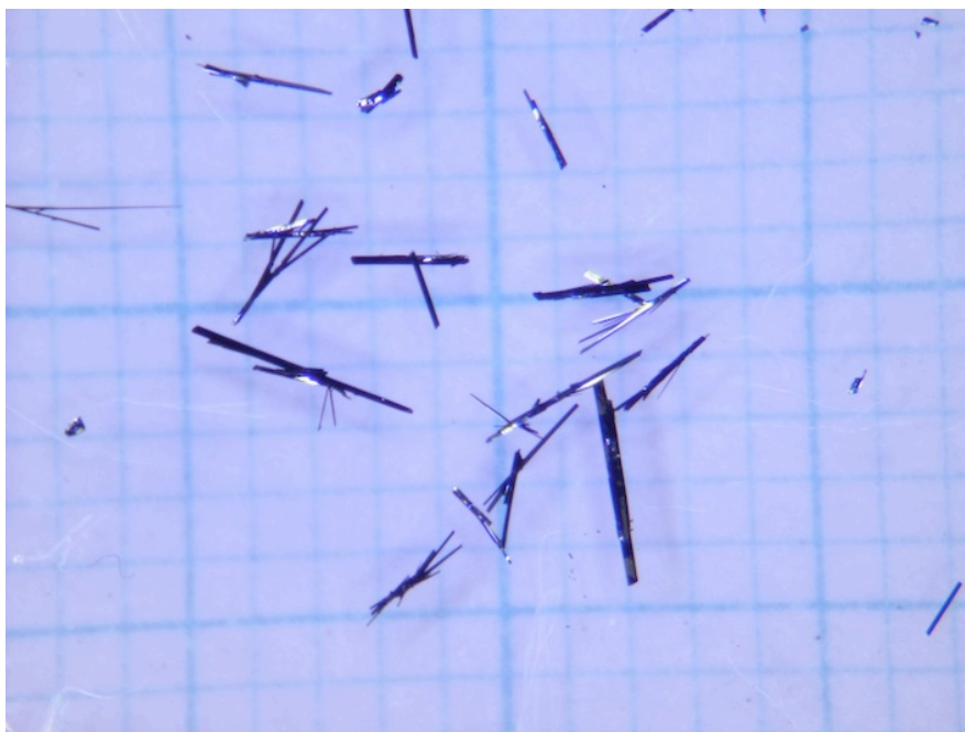
図 1 : 測定に使用した有機化合物 \beta -( meso -DMBEDT-TTF) 2 PF 6 の写真。数ミリ程度の長さをもった細長い形状をしている。